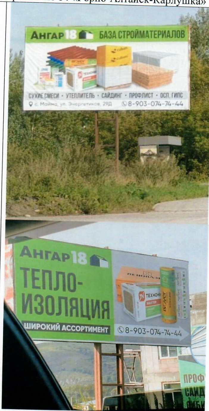
Фото рекламной конструкции

«30» сентября 2024 года отделом архитектуры и градостроительства Администрации муниципального образования «Майминский район» выявлена рекламная конструкция, установленная и (или) эксплуатируемая без разрешения, срок действия которого не истек, установленного по адресу (в случае отсутствия технической возможности определить точное местоположение, указывается ориентировочное расположение): в границах земельного участка с кадастровым номером 04:01:010409:1057, ориентир 2км.+335м. дорога 84К-14 «Горно-Алтайск-Карлушка» (слева).